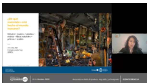
▲ Conferencia: Materiales en diseño de producto. Muy bello, ¿Se biodegrada? 08 de octubre de 2020