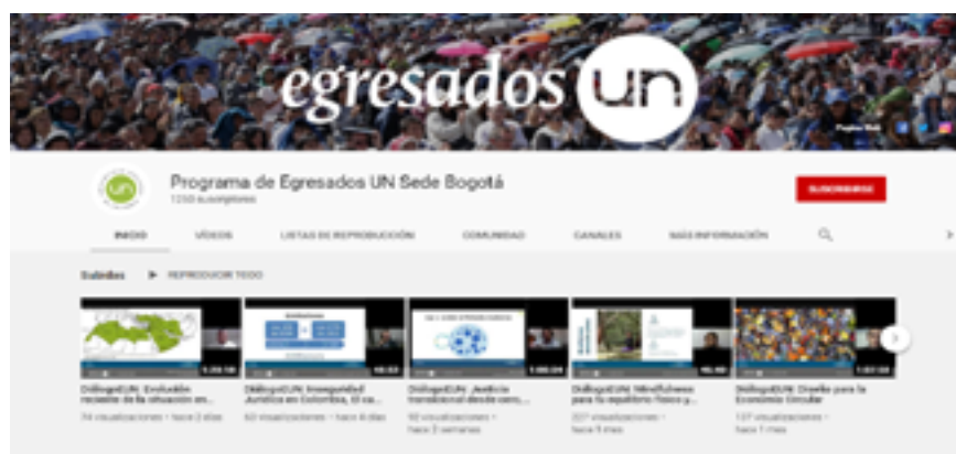
▲ Canal oficial de Youtube del Programa de Egresados - Sede Bogotá